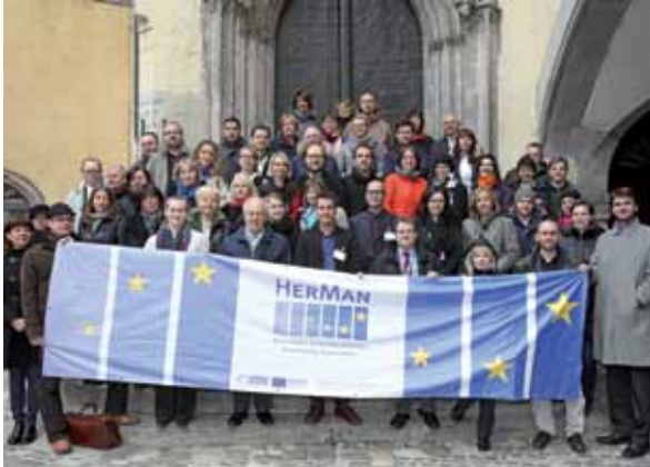
▲ A zárókonferencia résztvevői hat országból érkeztek