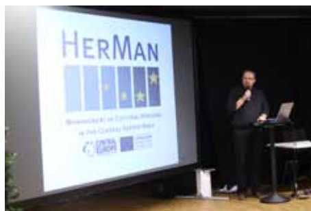
▲ A sokszínű konferencia részeként minden egyes partner bemutatta saját prezentációját is

A projekt a két és fél év alatt valamennyi kitűzött célt elérhette: munkatársak cserélátogatása történt a partnerek között, négy menedzsmentképzés megszervezése a partnerszervezetek szakértelmének megerősítése céljából, valamint számos olyan pilot tevékenység, melyeket a partnerek valósítottak meg. A Forster Központ például az ún. holland modellt vette át és próbálta ki Egerben, melynek lényege egy olyan jelzőrendszer kialakítása, amely a városi épített örökségben bekövetkező állagromlás korai észlelésére alkalmazható. Ravenna (Olaszország) egy olyan mobilapplikációt fejlesztett ki, amely a város kulturális kínálatát ismerteti az odátogatókkal, míg Regensburg (Németország) egy olyan kommunikációs modellt hozott létre, amely támogatja és elősegíti a kulturális világörökségi helyek azonosítását a városok és a látogatók számára.