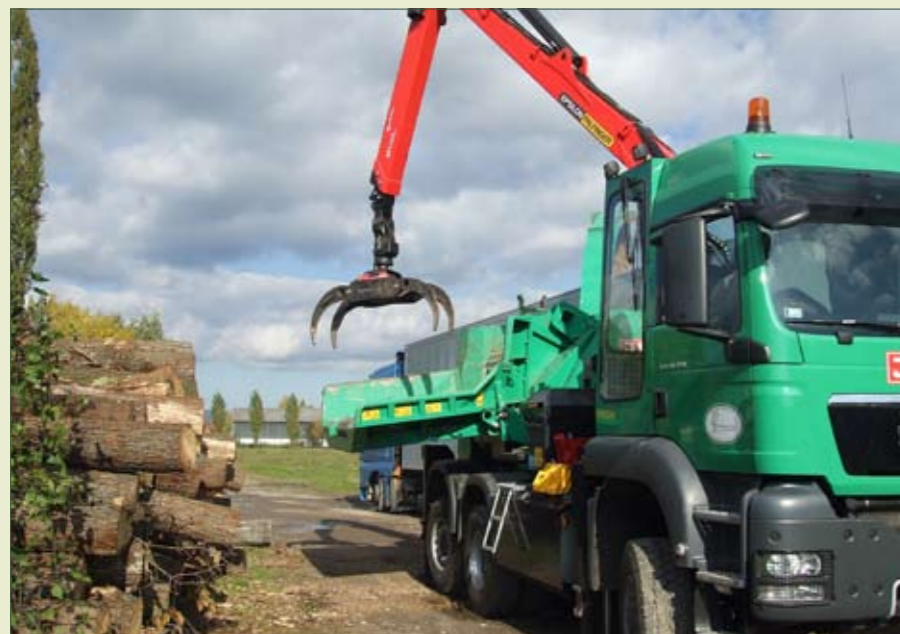
Az Egererdő mobilizálható tűzifa aprító-gépet vásárolt

NARANCSVIRÁG Egészségkuckó Kineziológia, házassági tanácsadás, stresszoldó tréningek www.kineziologuseger.hu ☎ (06 20) 9764 604